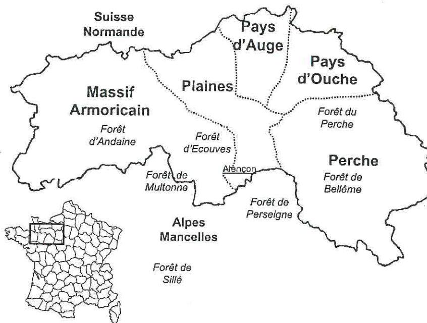
Figure 1 : Localisation des forêts et des régions naturelles du département de l'Orne et en périphérie. En caractères gras sont indiquées les régions naturelles. Leurs limites sont représentées par des pointillés. Les massifs forestiers sont en italique.

Parallèlement à ces recherches de terrain, l'A.F.F.O. s'est dotée d'une bibliothèque complète des articles de l'Abbé Letacq, savant naturaliste ayant vécu de la fin du XIX ème siècle jusqu'aux années 1920. Toutes les données herpétologiques de cette période concernant le département de l'Orne sont de Letacq. Les articles traitant du Lézard agile ont été soigneusement étudiés. La description des sites (toponymie, description géomorphologique) a très souvent été suffisante pour les localiser à quelques dizaines de mètres près. A partir de 1991 et jusqu'à actuellement, ces sites ont fait l'objet de visites afin d'essayer de retrouver les populations signalées.